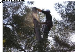
AG ALDE 12/03/2020